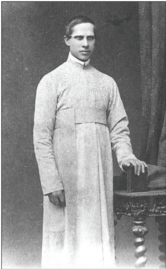
Ojciec Kazimierz Pestynek MIC (1828–1893). Fotografia z 2. poł. XIX w. Archiwum Prowincjalne Księży Marianów w Warszawie.