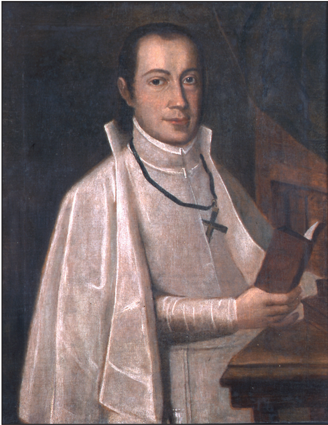
Czcigodny o. Kazimierz od św. Józefa Wyszyński (1700–1755). Obraz z 2. poł. XVIII w., przypisywany o. Janowi Niezabitowskiemu MIC (1744–1804). Klasztor marianów w Goźlinie.