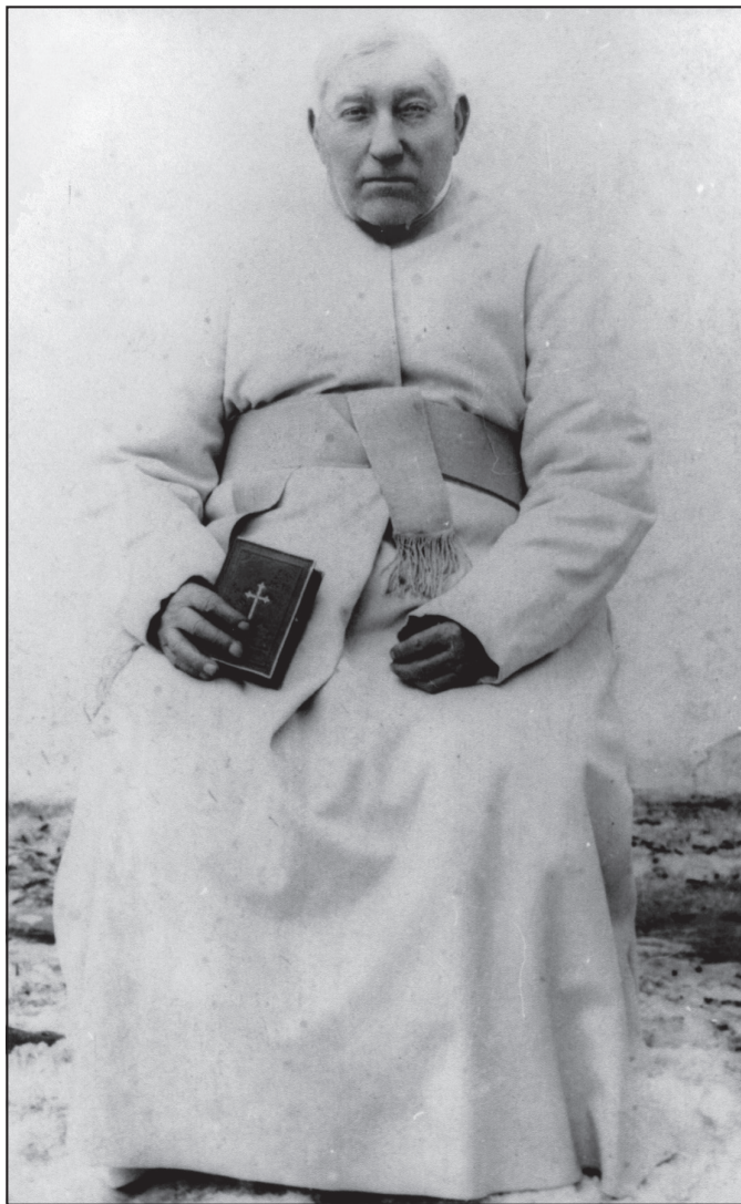
Ojciec Andrzej Jurewicz MIC (1823–1908). Fotografia z 2. poł. XIX lub 1. poł. XX w. Archiwum Księży Marianów w Warszawie.